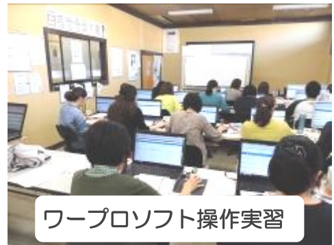
ワープロソフト操作実習