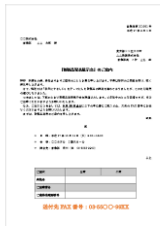
ワープロソフト操作実習