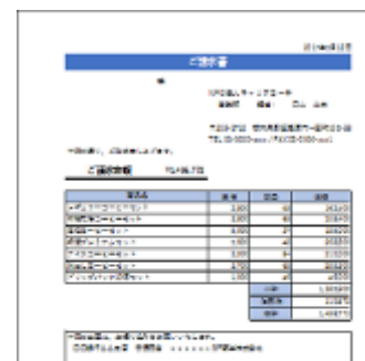
表計算ソフト操作実習